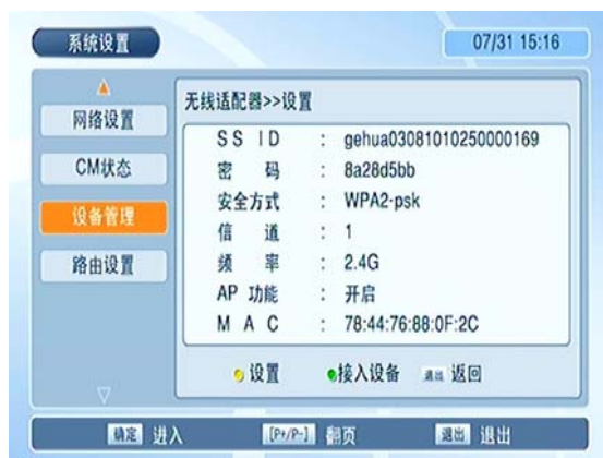
图 2 无线适配器设置