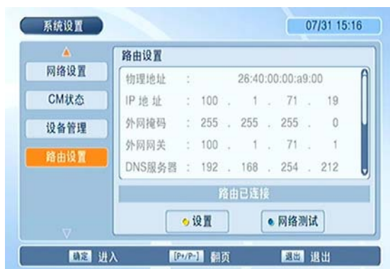
图 4 路由设置