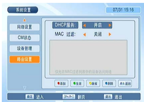
图 5 路由设置-设置