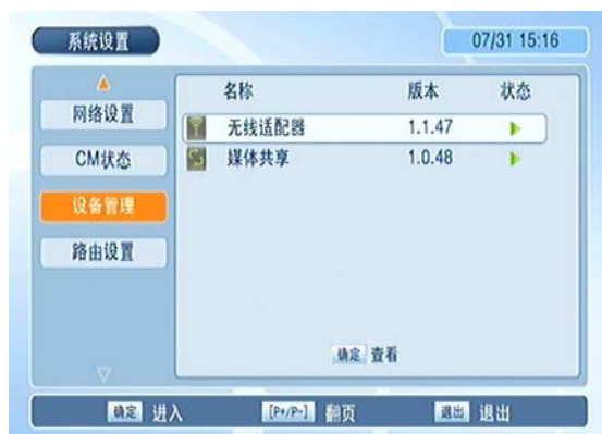
图 1 设备管理