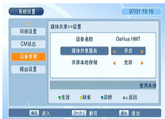
图 3 媒体共享设置